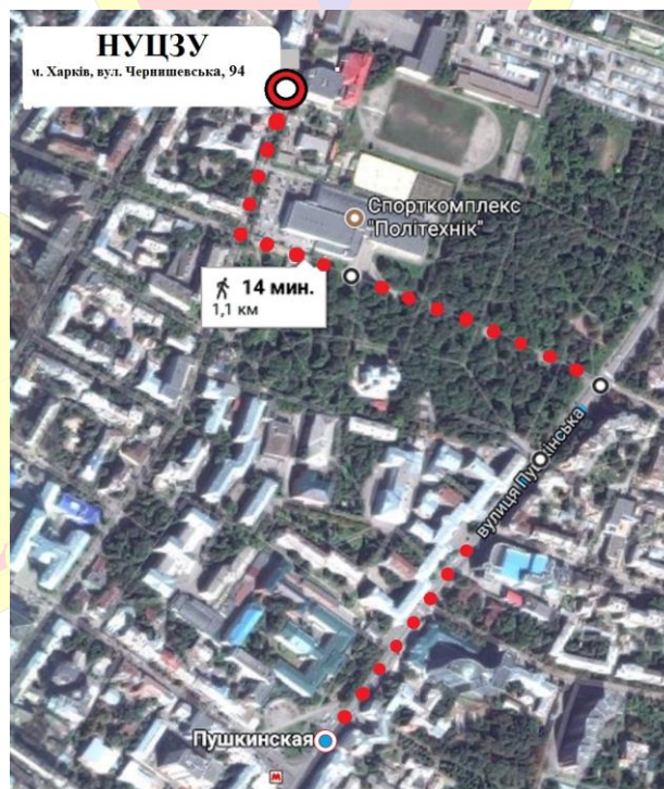
Схема маршруту від станції метро «Пушкінська» до університету (вул. Чернишевська, 94)

Проїзд від залізничного вокзалу до станції метро «Пушкінська»: на залізничному вокзалі посадка на станції метро «Південний вокзал», проїзд до станції «Майдан Конституції», перехід на станцію «Історичний музей», проїзд до станції «Пушкінська».